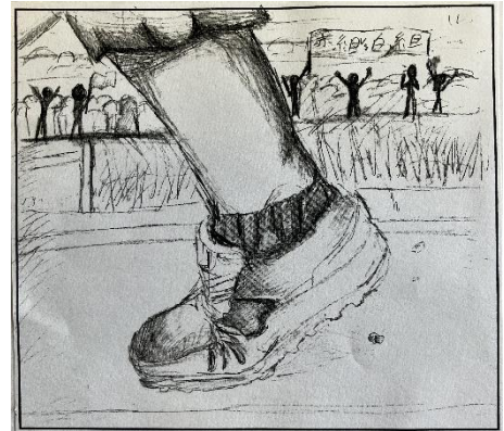
〈中高等部入選作品〉